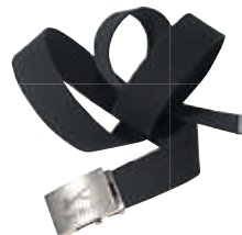
Gürtel Kofferband Schwarz 8401 9113-99 Länge: 115cm