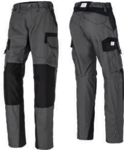
Anthrazit | Schwarz 2530 5370-9799 D34-D54