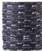
Multifunktionsstuch 8104 9214-99 One size