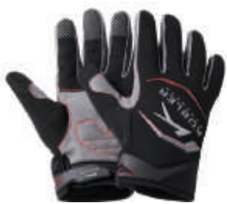
Arbeitshandschuhe 8001 9414-9995 S-3XL