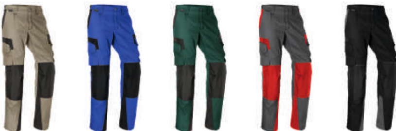
Sandbraun | Schwarz 2230 5370-2599 40-66, 90-118, 25-31