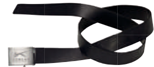
Ledergürtel 8401 9111-99 Länge: 115cm

Mehr Infos im aktuellen GESAMTKATALOG oder unter www.kuebler.eu