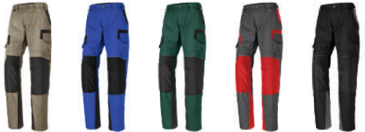
Sandbraun | Schwarz 2530 5370-2599 D34-D54