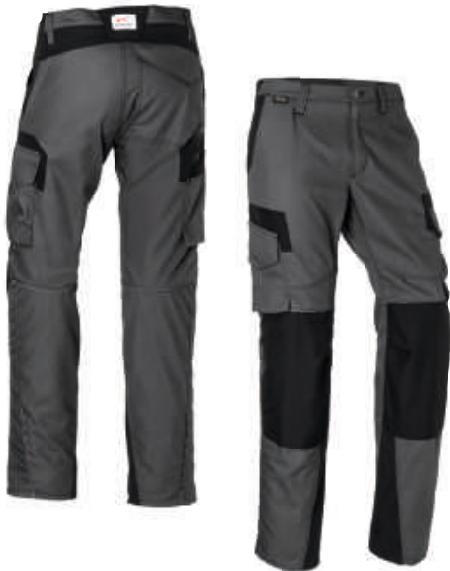
Anthrazit | Schwarz 2230 5370-9799 40-66, 90-118, 25-31