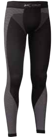
Schwarz | Anthrazit 8017 9213-9997 S/M, L/XL, 2XL/3XL