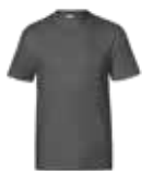
Anthrazit 5124 6238-97 XS-6XL