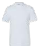
Weiß 5124 6238-10 XS-6XL