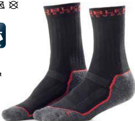
Schwarz | Anthrazit 8015 9316-9997 40-43, 44-47