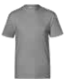
Mittelgrau 5124 6238-95 XS-6XL