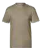
Sandbraun 5124 6238-25 XS-6XL