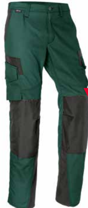
Moosgrün | Schwarz 2230 5370-6599 40-66, 90-118, 25-31

Zertifiziert nach EN 14404:2004 + A1:2010 Typ 2, Leistungsstufe 1 in Verbindung mit Knieschutzpolster Art. 8108 9119-45.