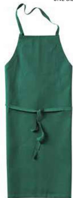
Sandbraun 8002 1311-25 ONE SIZE