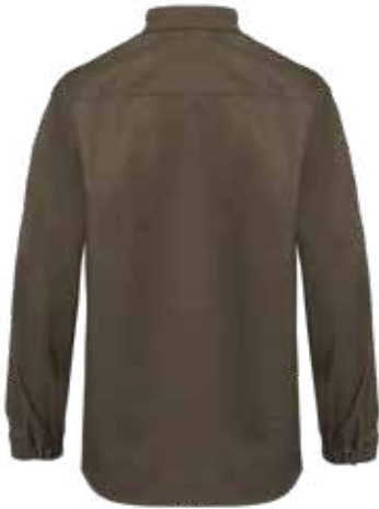
Oliv | Ginko 7152 8302-6662 XS-4XL