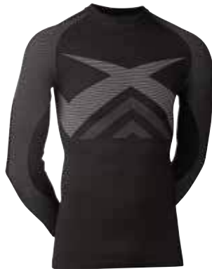
Schwarz | Anthrazit 8016 9213-9997 S/M, L/XL, 2XL/3XL