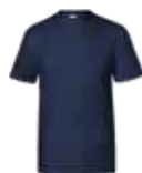
Dunkelblau 5124 6238-48 XS-6XL