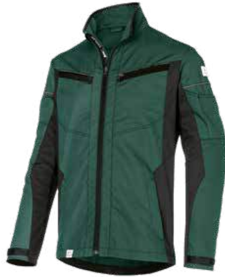
Moosgrün | Schwarz 1230 5370-6599 XS-4XL