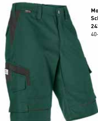
Moosgrün | Schwarz 2430 5370-6599 40-66