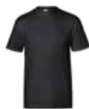
Schwarz 5124 6238-99 XS-6XL