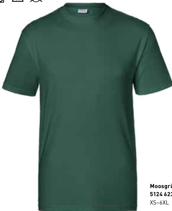
Moosgrün 5124 6238-65 XS-6XL